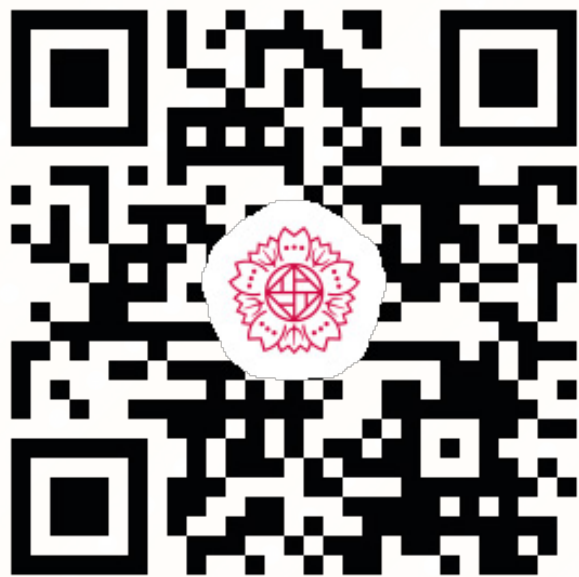
児童学科オリジナルホームページ